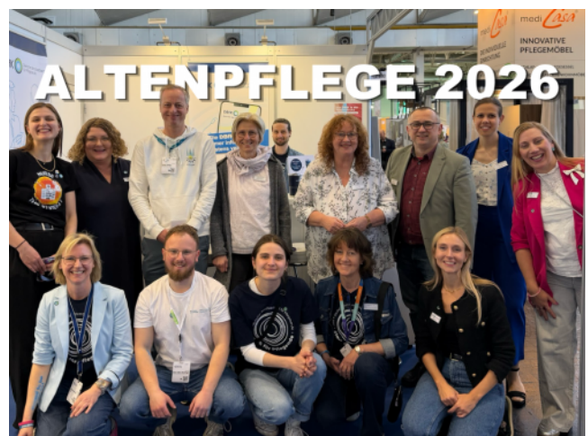
Mitglieder und Mitarbeitende des DBfK Nordwest sorgten für einen starken Messeauftritt des DBfK.

„Hallo, kennen Sie schon den DBfK?“ Diese Frage war ein Türöffner für zahlreiche Gespräche und persönliche Kontakte zwischen hauptamtlichen Mitarbeitenden sowie ehrenamtlichen Mitgliedern des DBfK Nordwest und Besucher:innen der ALTENPFLEGE-Messe vom 21. bis 23. April in Essen. Drei Tage lang war der DBfK-Messestand ein beliebter Treffpunkt für beruflich Pflegende.