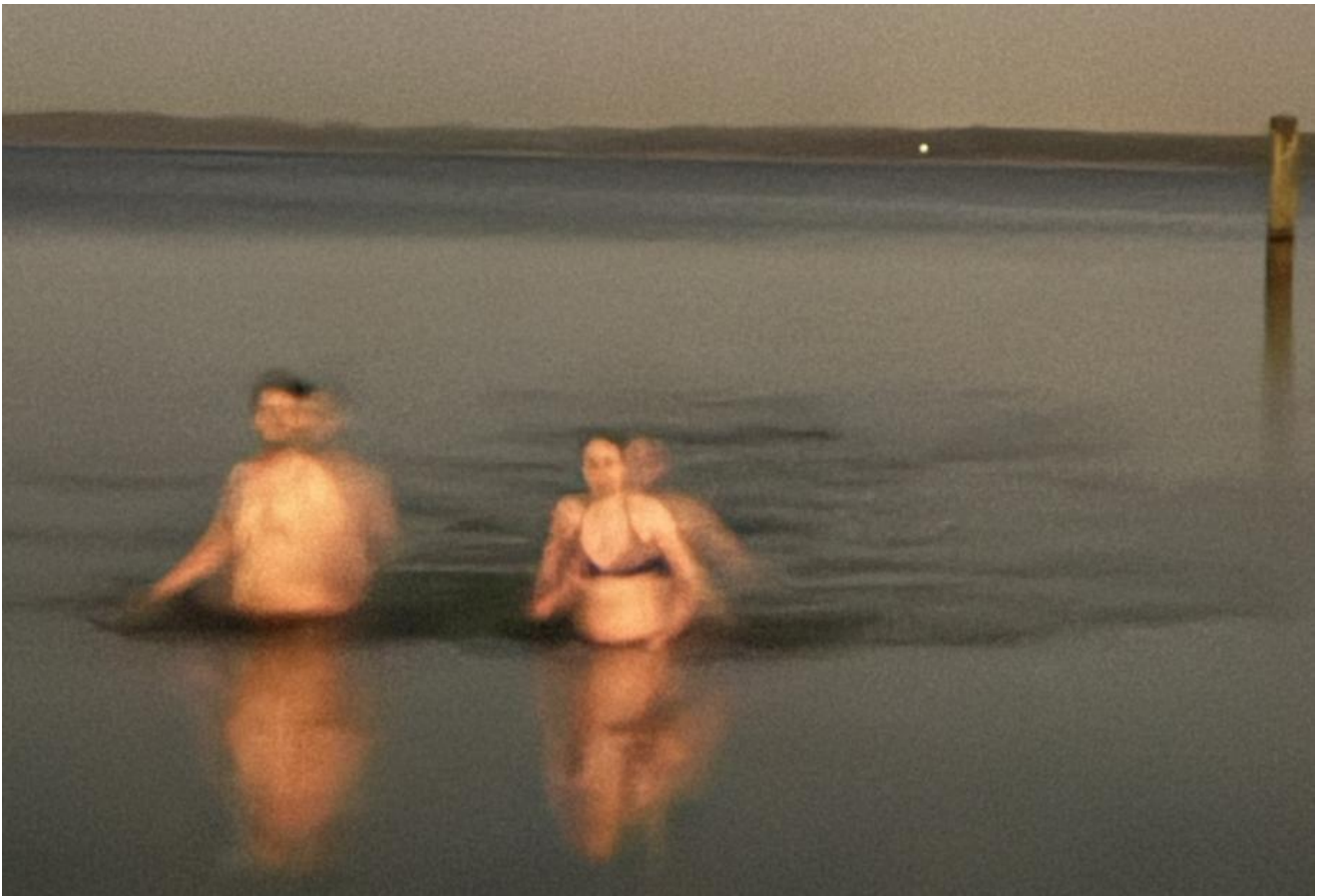
Anbaden in der Ostsee kurz nach Frühlingsanfang